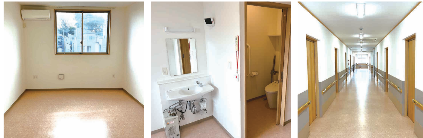
陽射しが入る暖かいお部屋でゆったりと生活していただけます。 独立洗面台と、トイレが各部屋に設備されています。 清潔感のある共用の通路です。