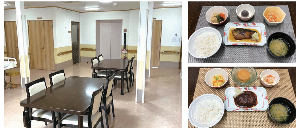
清掃が行きとどいた広々とした食堂では、お食事をしたり、入居者様同士や面会に来られたご家族とお話をいただけます。