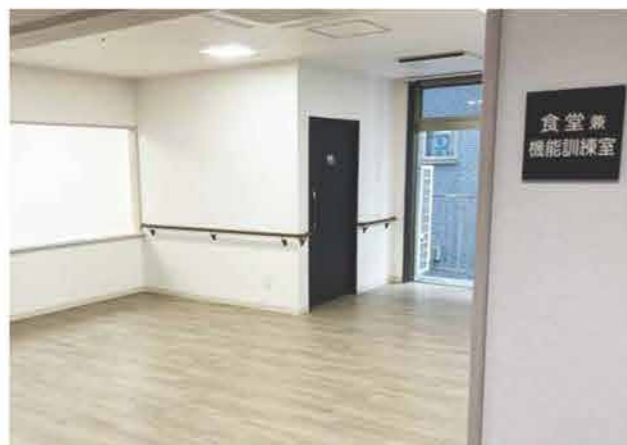
清掃が行きといた広々とした食堂では、お食事をしたり、入居者様同士や面会に来られたご家族とお話をいただけます。