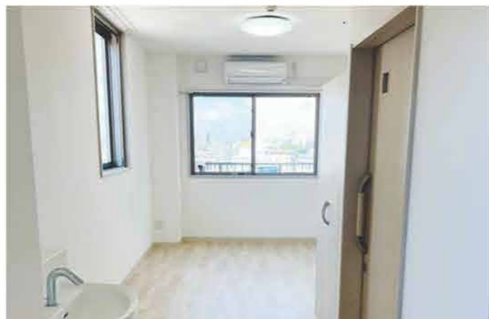
陽射しが入る暖かいお部屋でゆったりと生活していただけます。