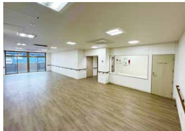
清掃が行きといた広々とした食堂では、お食事をしたり、入居者様同士や面会に来られたご家族とお話をいただけます。