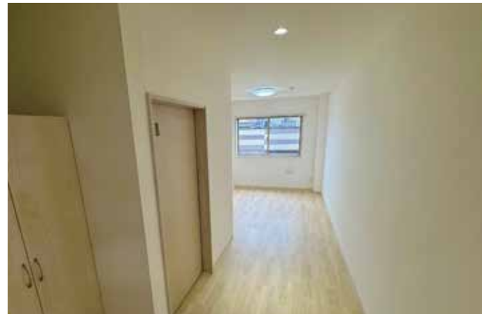
陽射しが入る暖かいお部屋でゆったりと生活していただけます。